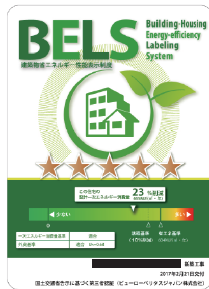
▲弊社 BELS 認証ラベル事例

BELSの5段階の★マークのレベル。数値はBEI。BEI=設計一次エネルギー消費量(OA機器、家電などを除く)÷基準一次エネルギー消費量(OA機器、家電などを除く)(資料:国土交通省の資料をもとに作成) BEIが1.0以下であれば省エネ基準に適合し、数値が小さいほど省エネ性能が高いと言えます。オークラホームの住まいは5つ星の表示ができる高性能住宅が標準です。