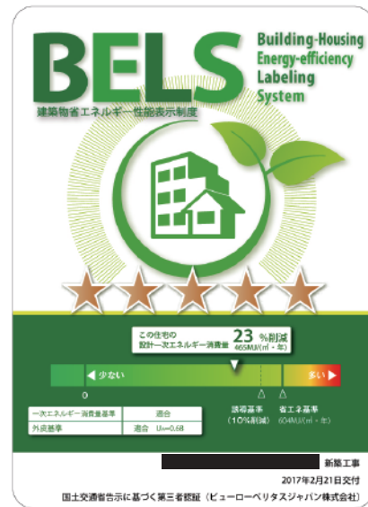
▲弊社 BELS 認証ラベル事例

BELSの5段階の★マークのレベル。数値はBEI。BEI=設計一次エネルギー消費量(OA機器、家電などを除く)÷基準一次エネルギー消費量(OA機器、家電などを除く) BEIが1.0以下であれば省エネ基準に適合し、数値が小さいほど省エネ性能が高いと言えます。オークラホームの住まいは5つ星の表示ができる高性能住宅が標準です。